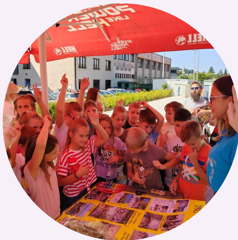
Obilježavanje važnih datuma (Dječji tjedan, Međunarodni dan obitelji...)