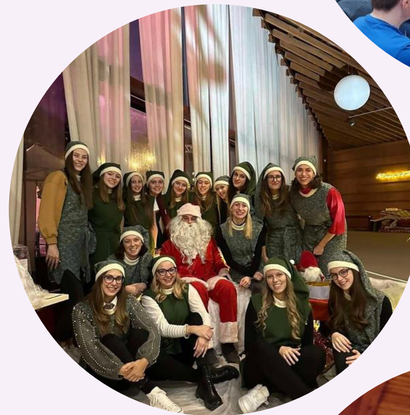
Volonterske akcije i rad s volonterima