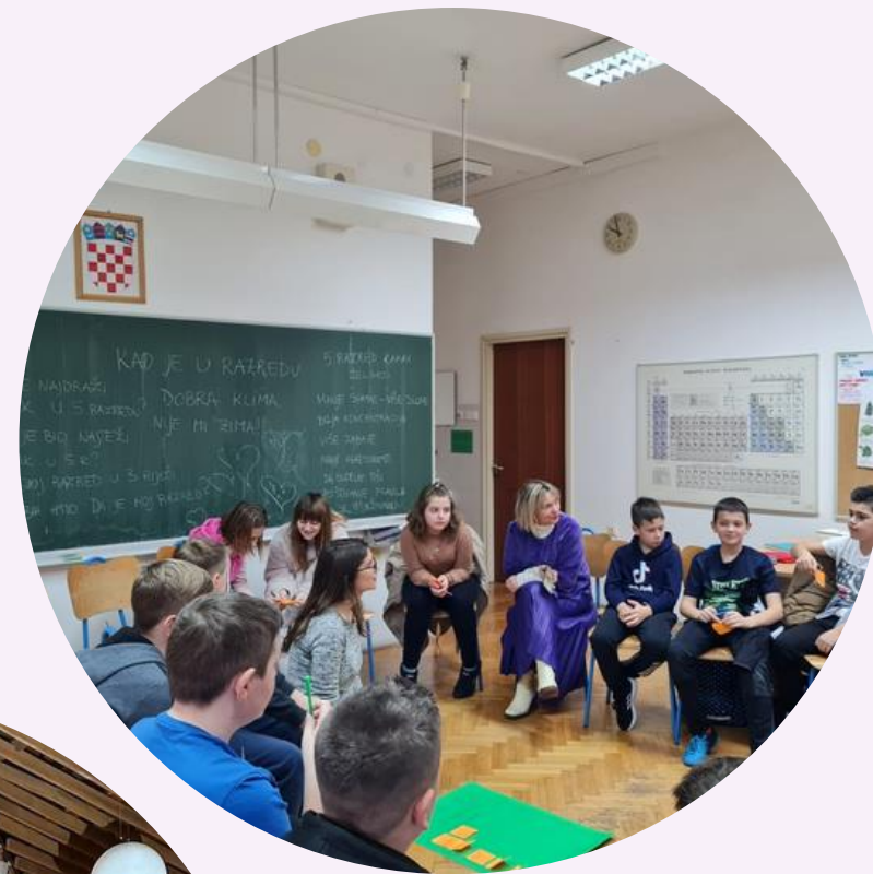
Provedba preventivnih radionica u školama