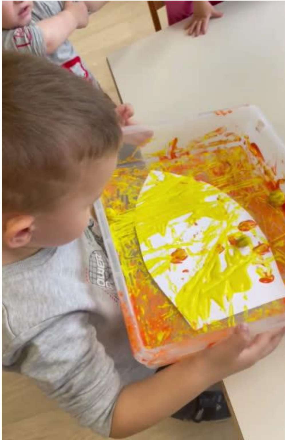
LIKOVNO IZRAŽAVANJE KROZ POKRET