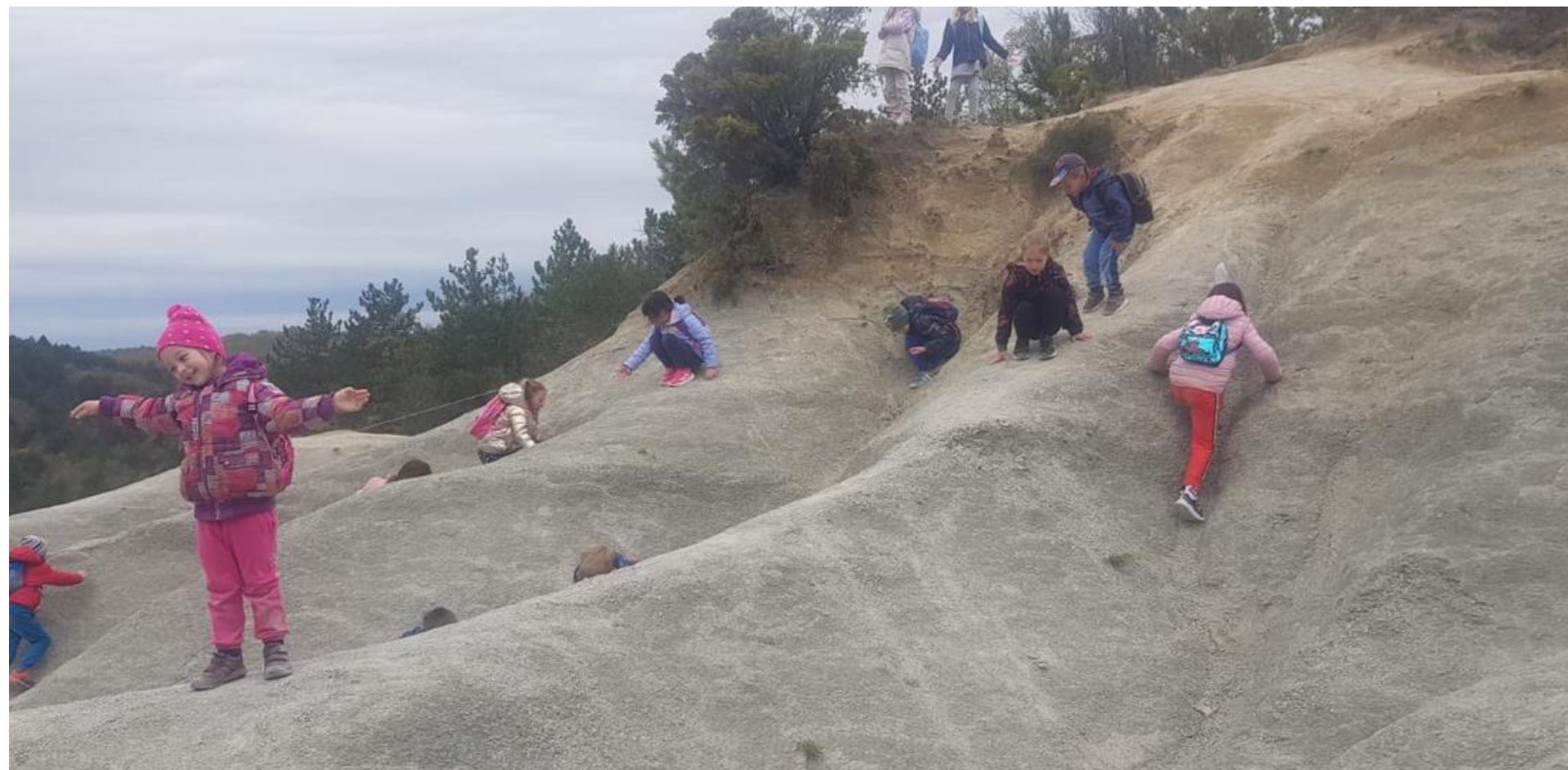
PISKI - Šterna