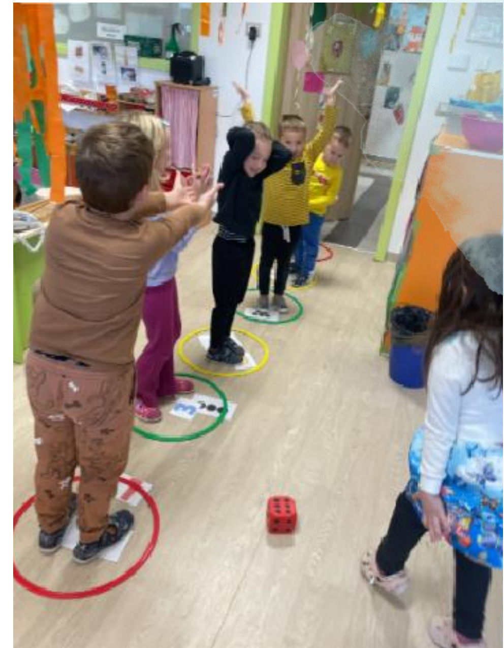
POKRET i razvoj predmatematičkih vještina