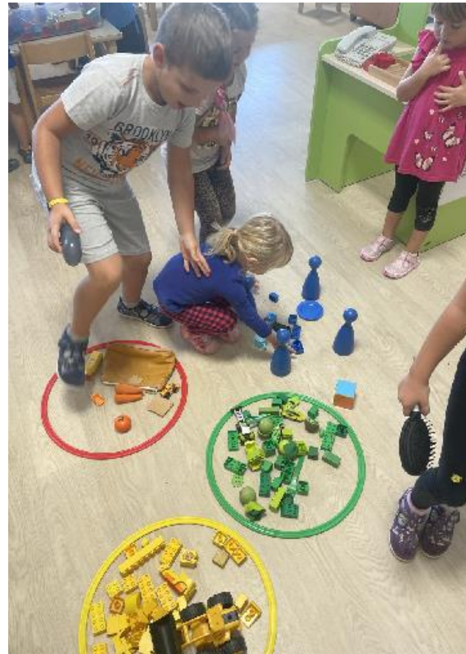
USVAJANJE BOJA KROZ POKRET